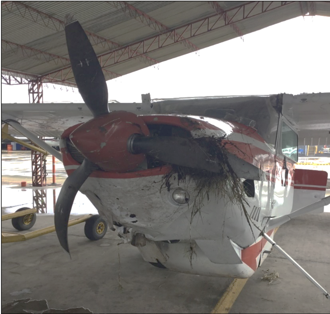
Fotografía No. 2: Daños en las palas y estructura