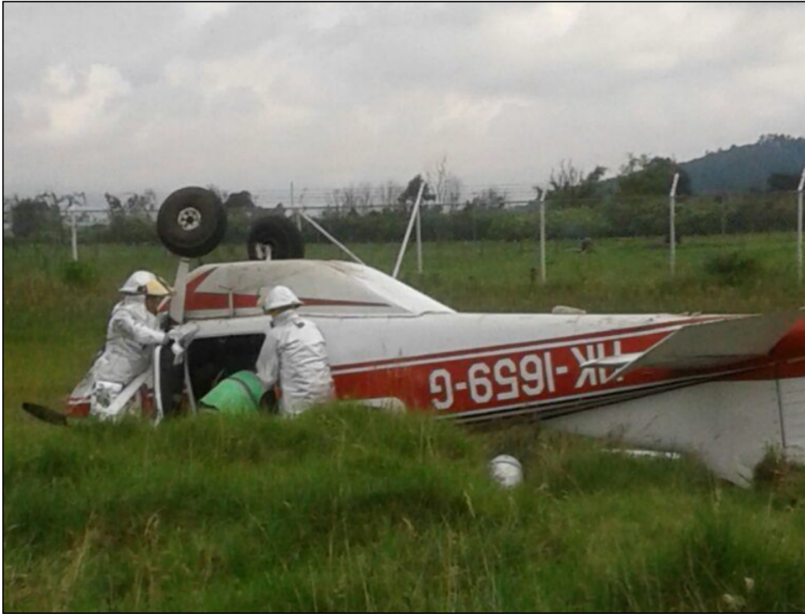
Fotografía No. 1: posición final de la aeronave