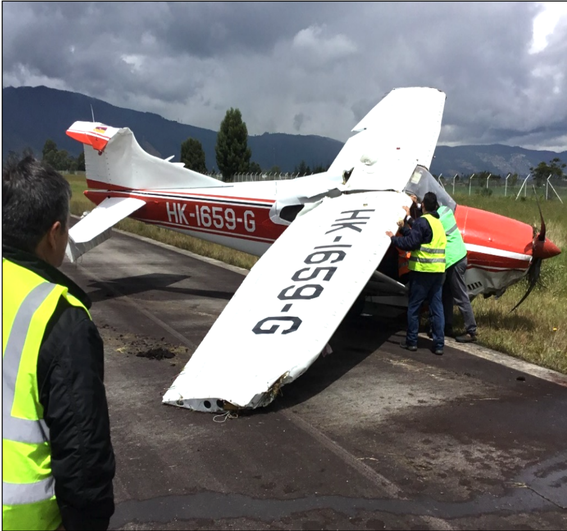
Fotografía No. 3: Procedimiento de rescate de la aeronave

Las palas de la hélice presentaron deformación en su cuerpo hacia atrás, sin entorchamiento en sus puntas, lo que evidencia bajas RPM al momento del contacto.