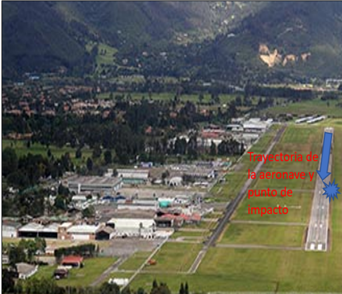
Imagen No. 1: trayectoria de la aeronave sobre la pista